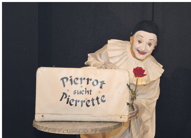
... auf der ewigen Suche nach dem Glück.